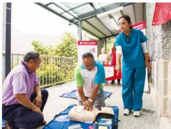
田知學醫師常參與公益活動。