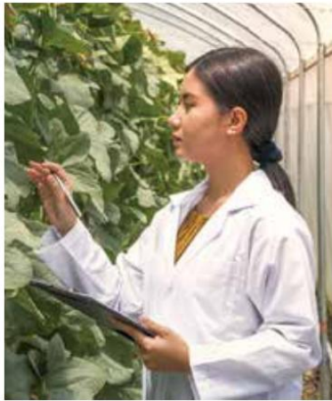
桃園市政府鼓勵女性勇於追求自我。

為推動本市智慧教育，本市成立智慧教育聯隊熱血教師（到校分享教師）服務團隊，總計成員 42 人，其中女性 17 人，男性 25 人，性別比例為 40.47% 及 59.52%，女性比例達 4 成以上，