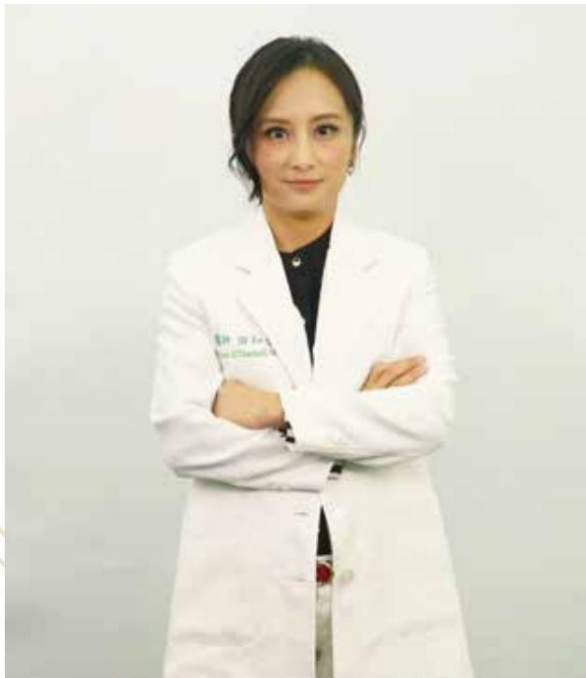
田知學醫生以身為原住民族為榮。