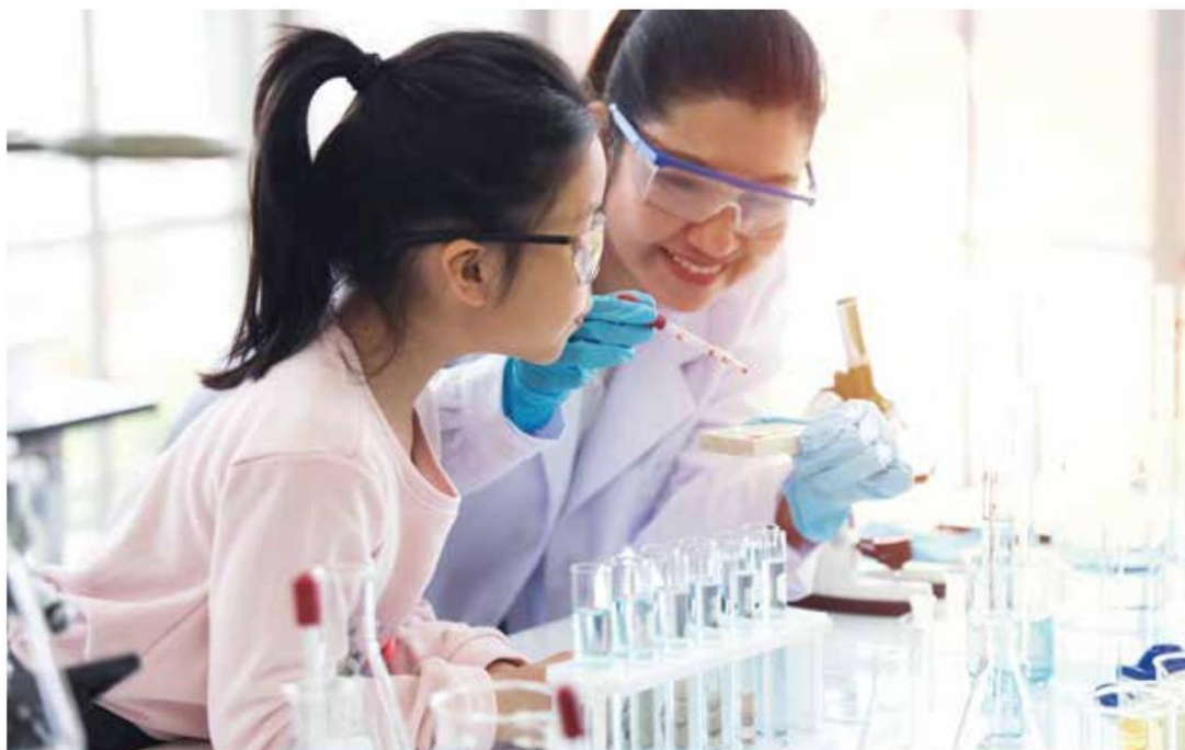
透過學習 STEM，幫助孩子建立帶得走的能力。

桃園市政府今（110）年責由勞動局、桃園市政府青年事務局、桃園市政府資訊科技局、桃園市政府文化局、桃園市政府客家事務局、桃園市政府原住民族行政局等單位，在辦理技藝教育及育樂營等各種教育場景運用更多電腦科技，讓學生自然養成與時俱進的能力與習慣，並且善用工具，獲得帶